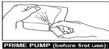
PRIME PUMP (before first use):